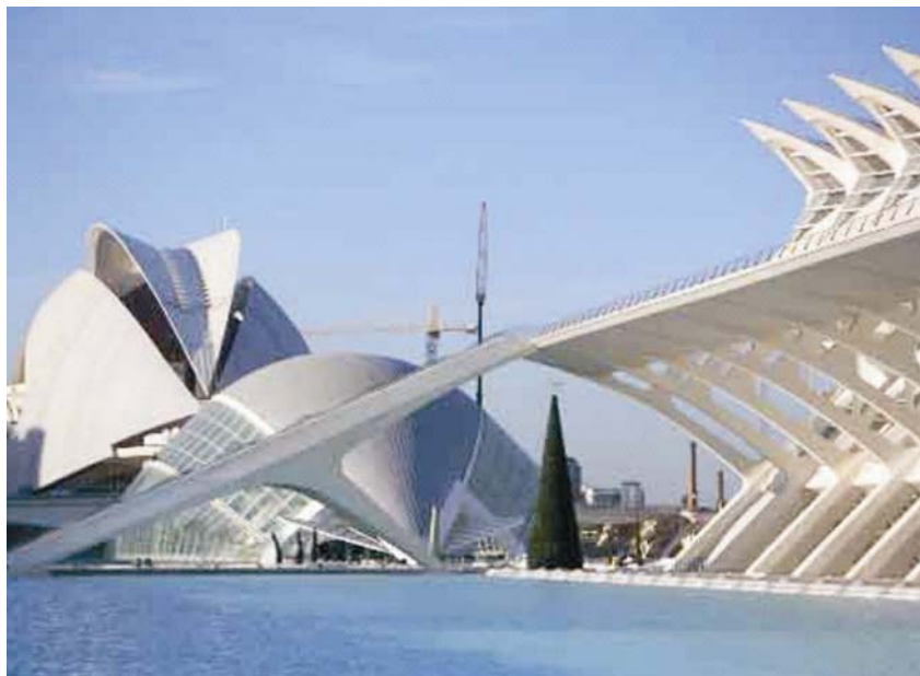
Palau de les Arts Reina Sofia u Valenciji

nu" građevinu. Ekspresivna forma, prožimanje betonskih ljsaka te dimenzije građevine, rezultiraju uvijek