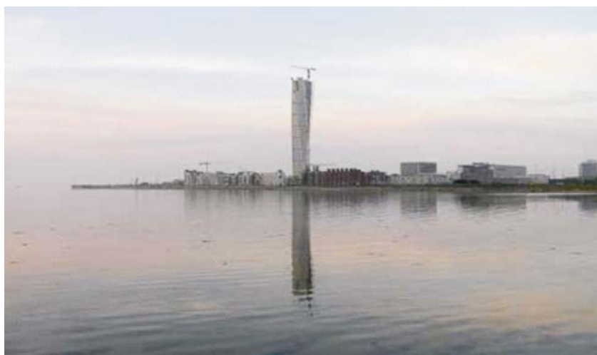
Turning Torso u Malmeu

Turning Torso je neboder geometrijski jednostavne forme, pet vertikalnih segmenata zakrivljenih oko središnje jezgre prati devet horizontalnih jedinica koje pri optičkom doživljaju građevine reduciraju njezinu stvarnu visinu. Građevina postiže osnovnu arhitektonsku komunikaciju s četiri pilona, koji nose prije pet godina otvoreni vodeni most između Danske i Švedske.