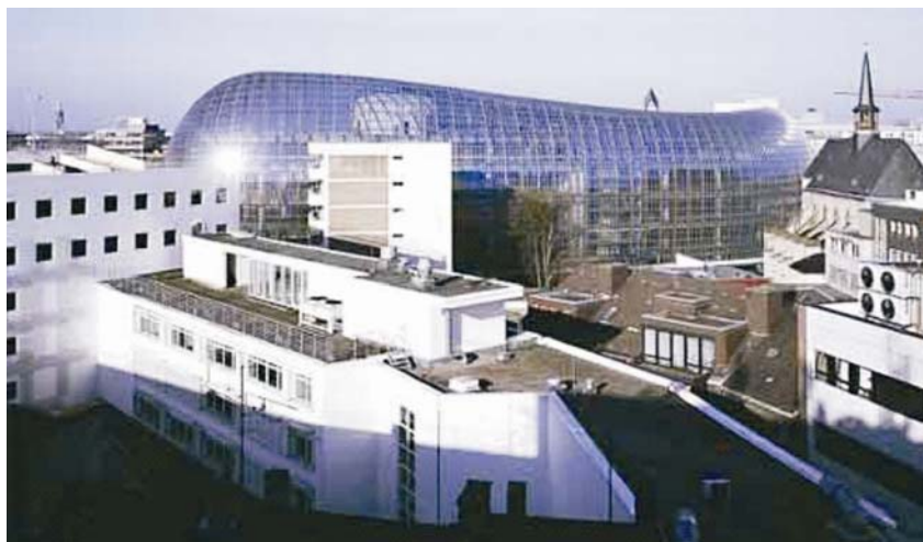
Robna kuća Peek & Cloppenburg u Kölnu

Renzo Piano projektirao je robnu kuću u Kölnu koja je otvorena 7. rujna 2005.